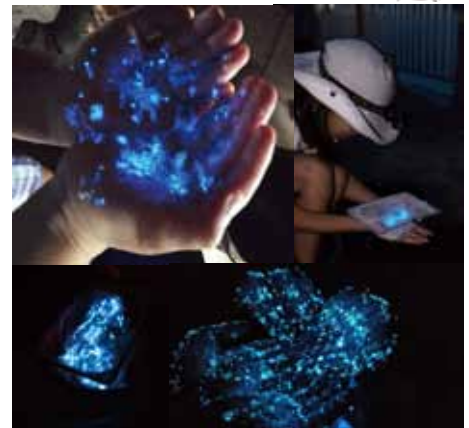
手の上で発光体験