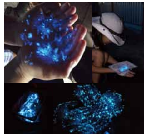
手の上で発光体験