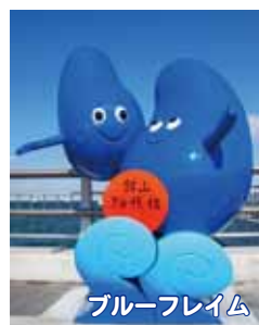
ブルーフレイルム